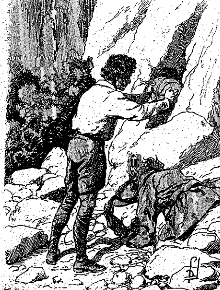
*Εδесе τό πακέτο με τό σχολί... (Σελ. 134, σι. γ)